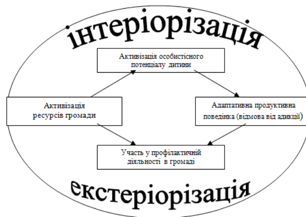
Рис. 1. Ресурсно-середовищний компонент системи профілактики адиктивної поведінки дітей в умовах територіальної громади

Наявність в системі такого компоненту, як запропонований у цій статті ресурсно-середовищний, передбачає врахування і ефективне використання регіональних особливостей і потенціалу. Зовнішні макро-, мезо- та мікрофактори повинні спрямувати на розвиток ресурсів громади, її соціальних інститутів, сім'ї, особистості, на підвищення їх адаптаційного потенціалу. Пропонуємо розглянути ресурсно-середовищний компонент за допомогою такої схеми (рис. 1).