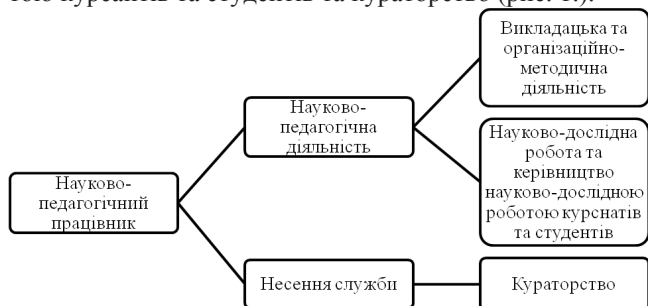
Рис. 1 – Напрями професійної діяльності науково-педагогічного працівника вищого навчального закладу цивільного захисту

Напрями професійної діяльності науково-педагогічного працівника ВНЗ цивільного захисту передбачають викладацьку, наукову, організаційно-методичну, службову діяльність, керівництво науково-дослідною роботою курсантів та студентів та кураторство (рис. 1).